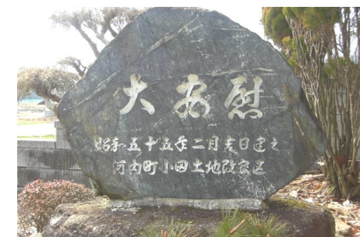
大安慰は浄蓮寺境内の西側にあります