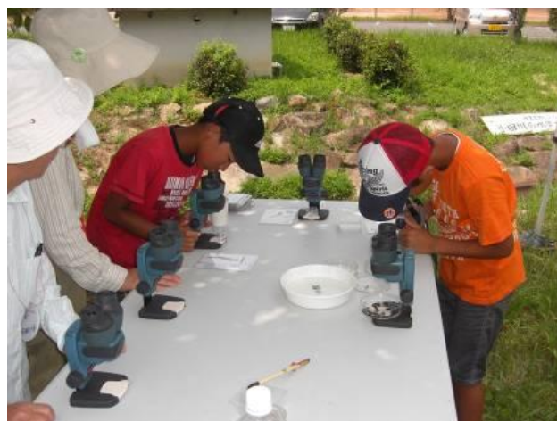
顕微鏡をのぞき驚きの声を上げる子ども