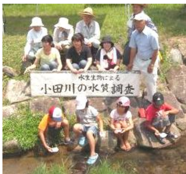
みんなで記念写真をパチリ