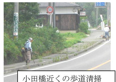
小田橋近くの歩道清掃

小田橋バス停から11組の歩道の除草作業を環境保全部のみならずと各部長、副部長の協力で行いました。