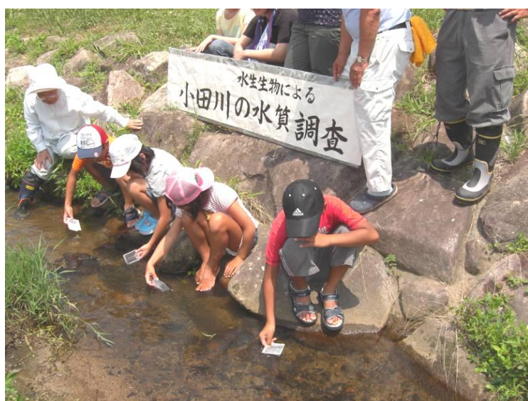
もっと増えるようにホタルの幼虫を放流する