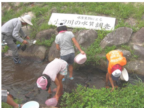
草の近くの水生生物を喜んで採集する