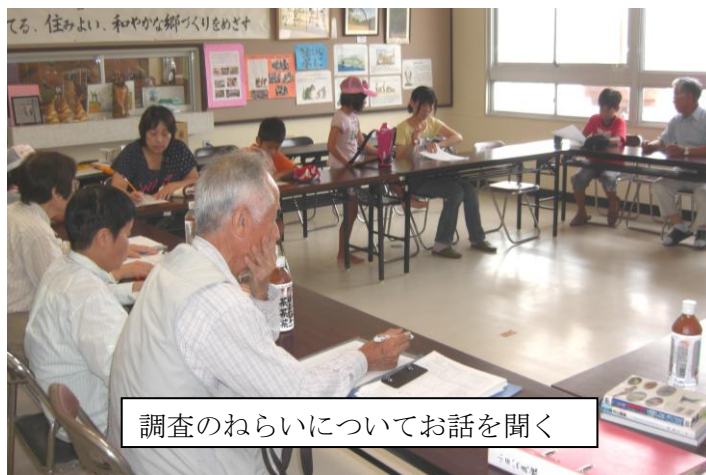
調査のねらいについてお話を聞く

参加した子どもたちは、専門家の指導で学習し、夏休みのよい思い出となることでしょう。