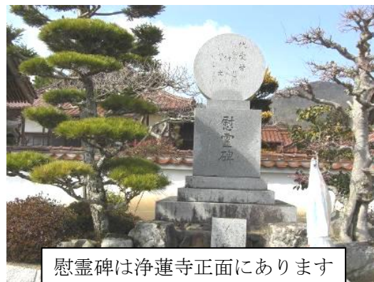
慰霊碑は浄蓮寺正面にあります