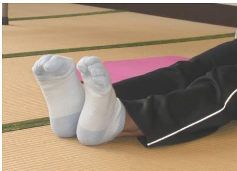
足の指でグー。ものがつかめますか