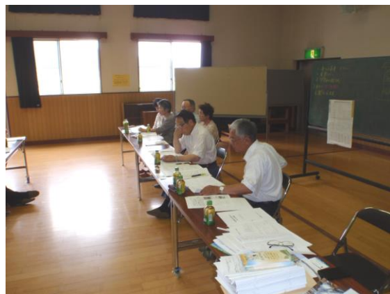
説明する瀬川会長・吉弘組合長理事ほか