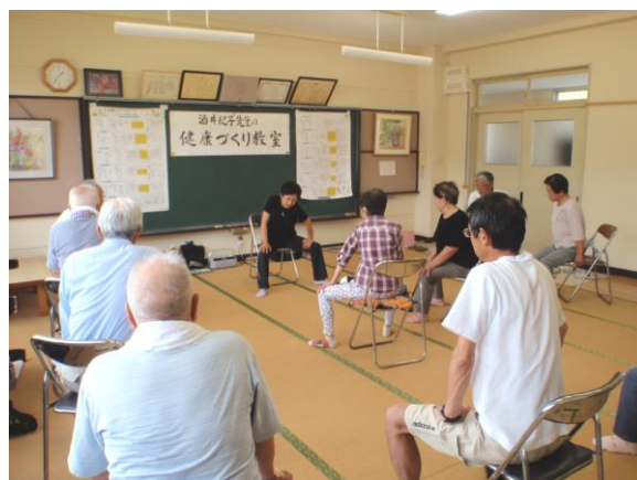
股関節をやわらかくする