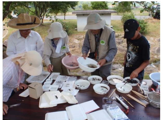
水生生物を分類する様子