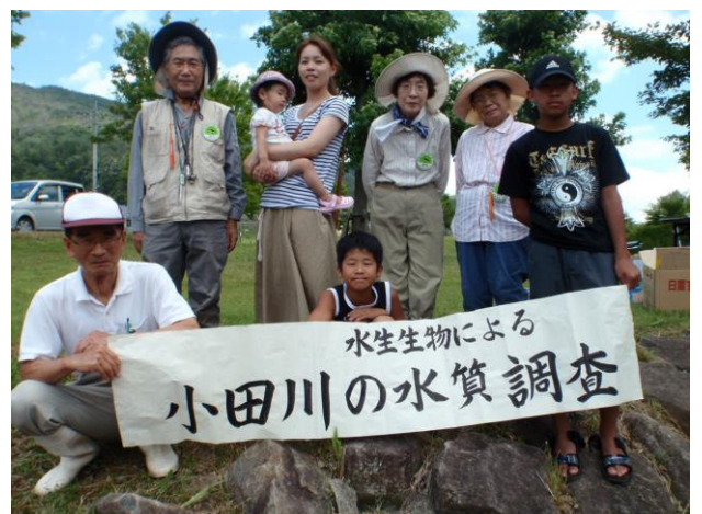
みんなで記念写真をパチリ