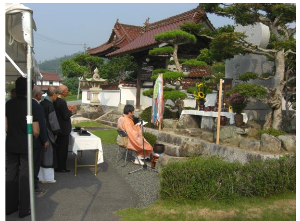
昨年の追悼法要の様子

昨年は、43名の参列で行われましたが、今年は昨年よりも多くのご参列のもとに執り行いたいと望んでおりますので、ご案内申し上げますと共に多くの皆様のご参拝をお願いします