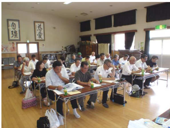
三原村推進協議会の皆様