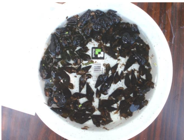
ほたるの餌となるカワニナ