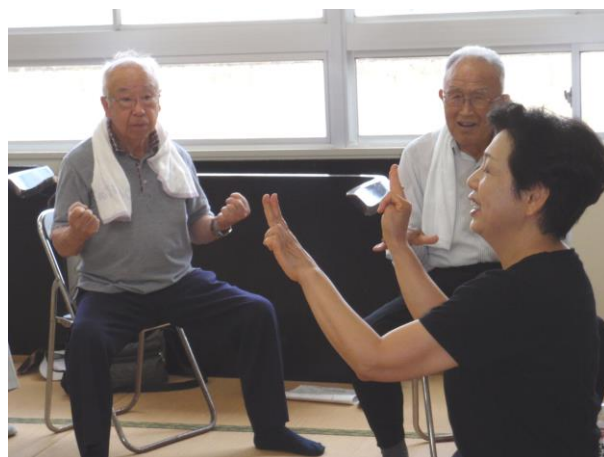
両手の指を左右交互に入れかえる運動