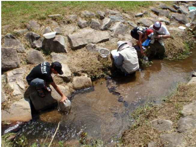
水生生物を採取する様子