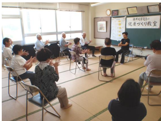
「いきいき体操ひがしひろしま」をくり返し練習しました