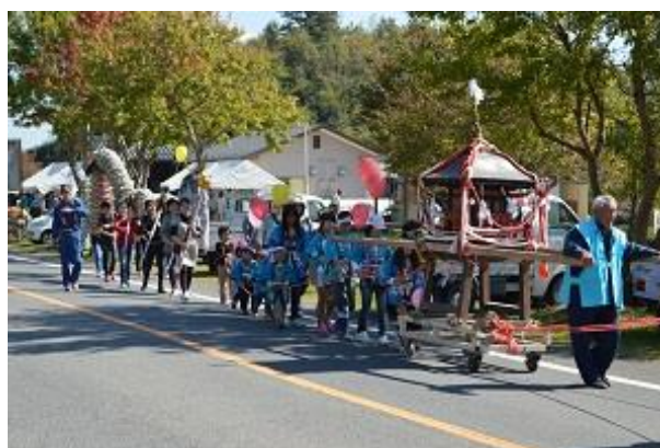
神社へ向かう「神輿」と「龍」