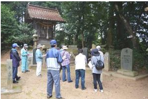
「文明詩碑」「仏典逆修碑」研修の様子