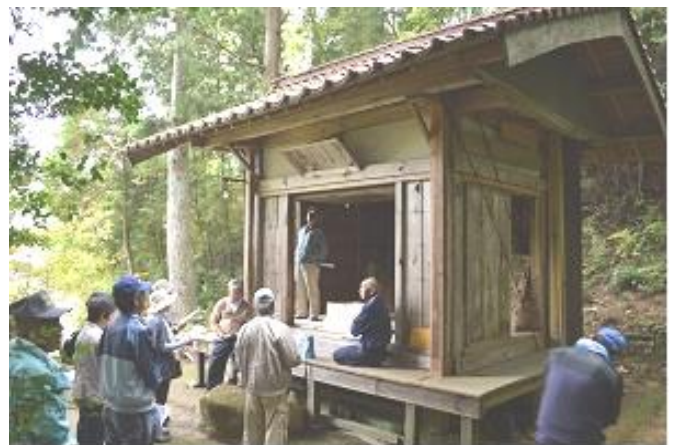
浄楽寺瑠璃殿で説明を受ける様子