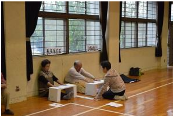
長座体前屈の様子

体力測定は、①握力、②上体起こし、③長座体前屈、④開眼片足立ち、⑤10m障害物歩行、⑥6分間歩行テストの各種目について行い、その結果を換算しグラフに表しました。前年の記録と比べている方もおられました。