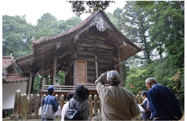
本殿の彫刻を見上げる