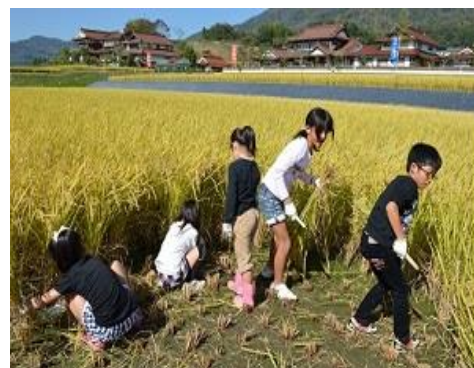
河内西小学校児童

収穫の後は、皆さんと一緒に八幡神社に向かって、「神輿」を引き、伝統の「神楽」や河内西小学校5・6年生による「巫女の舞」「子ども神楽」など鑑賞しました。