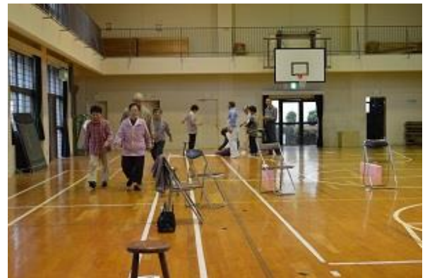
6分間歩行テストの様子