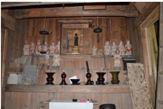
12神将軍(浄楽寺瑠璃殿)