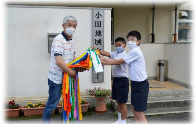
児童から小早川会長へ

小田地区の児童たちが、平和を願い 折った、折り鶴が届きました。折り 鶴には、1年生から6年生まで「平 和の願い」と題し各学年のメッセー ジが添えられています。