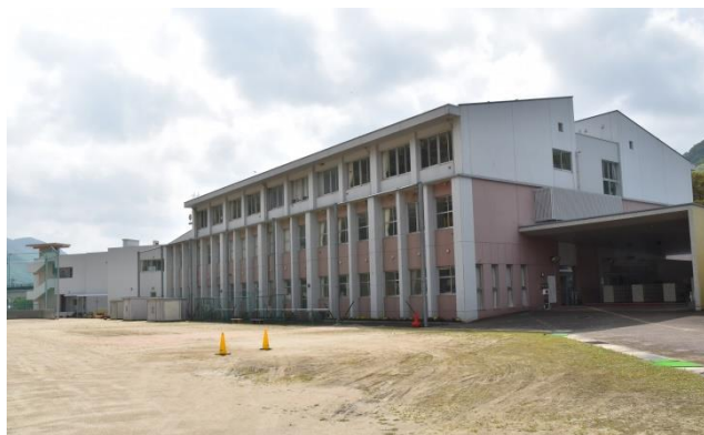
河内小学校（奥）・河内中学校（手前）