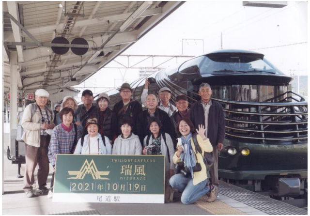
小田写真教室・小田地域センター