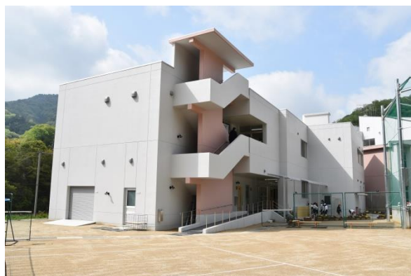
新校舎河内小学校

現在小田地区の児童 16 名（全児童 65 名）が、本年 4 月から河内中学校敷地内に整備された小中一体型の新校舎へ通学しています。その新校舎の落成式が 5 月 13 日に行われます。