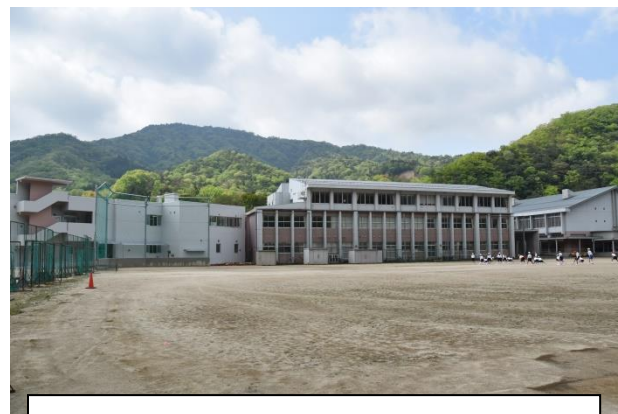
河内小学校（左）・河内中学校（右）