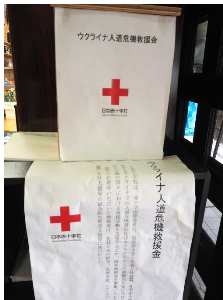
救援金募金箱 (店内設置)

また、当日会場内にウクライナ人道機器救援金の募金箱を設置しましたところ、たくさんのご協力をいただき有難うございました。皆様のご協力により、16,282円の救援金があり市役所(河内支所)を通じ日本赤十字社広島県支部長からウクライナ人道危機救援金として受領いただきました。この救援金