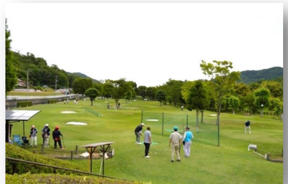
令和元年6月大会の様子