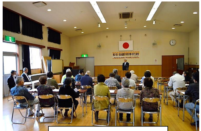
挨拶をする小早川会長