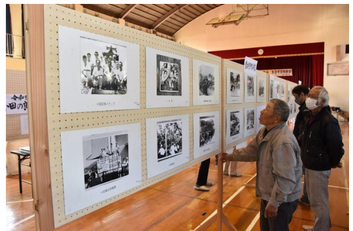
みんなぞく事始めの会展示