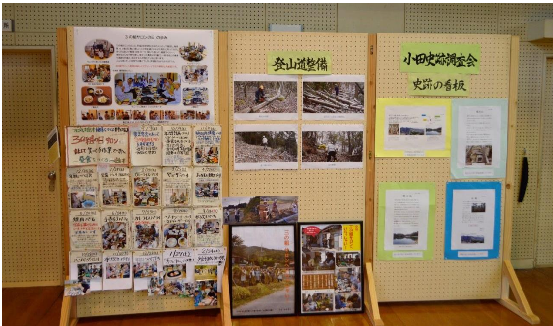
3の組の日サロン歩み写真