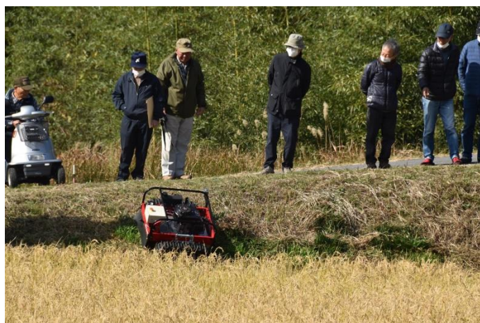
ラジコン草刈機（3号機）実演の様子