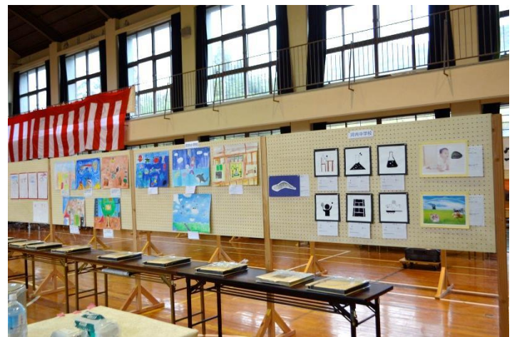
保育所・小学校・中学校作品展示