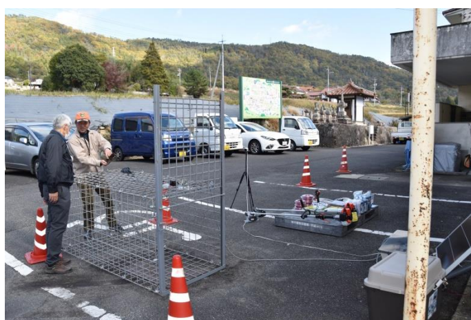
スマホ遠隔操作イノシシ箱罟実演の様子