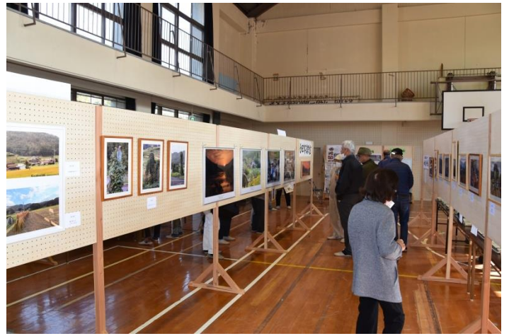
小田写真教室展示