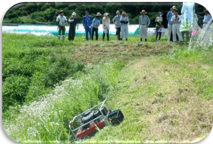
ラジコン草刈機実演

草刈省力化の第一歩として、小田地区農地保全会が導入しました草刈実演会をしました。