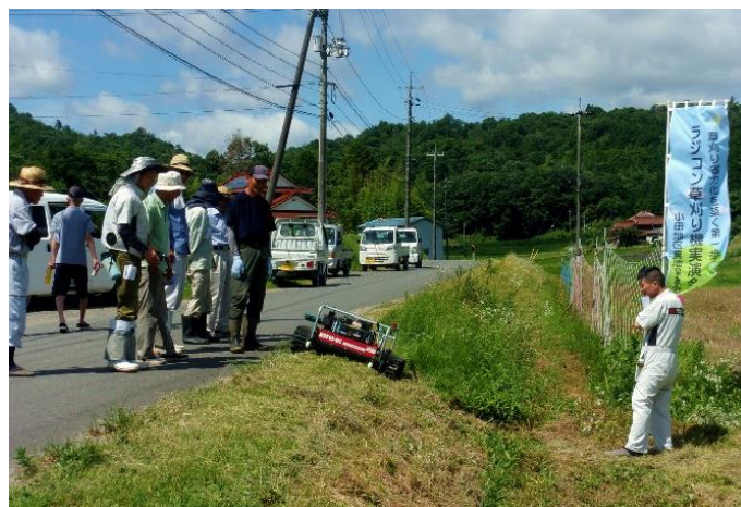
ラジコン草刈機実演

で使用していただきます。ラジコン草刈機の貸し出しは無料で、燃料、オペレーターは使用者の負担となります。小田地区農地保全会運営委員さんを中心に活用ください。使用される方は地域センターグラウンドで操作方法等習得していただきますので事前にご連絡ください。