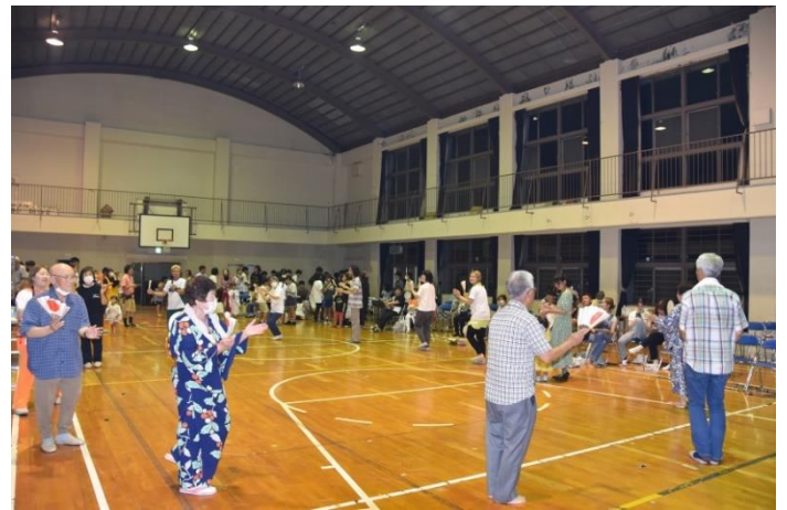
昨年の夏祭り会場

テーマは、「未来へつなごうふるさとの和」を掲げ、神楽、小田踊り(盆踊り)、夜店では、かき氷、綿菓子、金魚(おもちゃ)すくい、子どもの手持ち花火など、8時30分から大花火を打ち上げます。