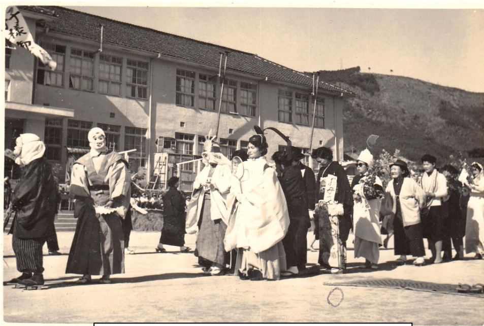
旧小田小学校で仮装行列 昭和？年頃

小田みんぞく事始めの会は、来る11月24日開催の生涯学習発表会に向け、記憶を留めるなつかしい、思い出の写真を募集しています。