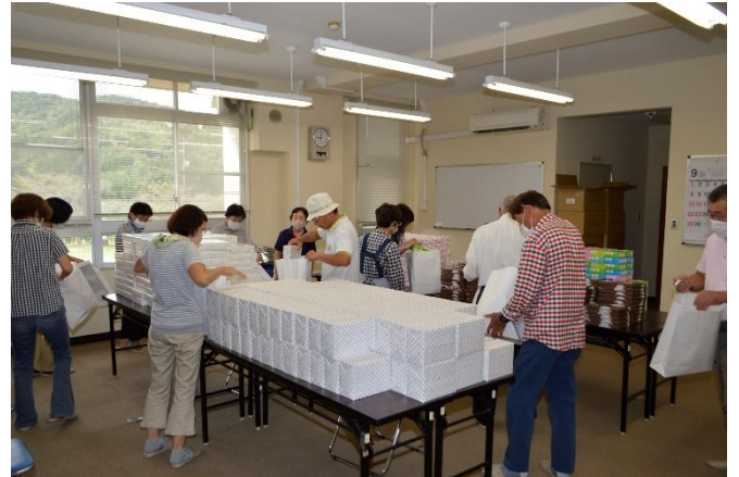
記念品発送準備の様子

記念式典、祝賀会は中止となりましたが、招待敬老者 115 名の皆様にお贈りする記念品の発送を実行委員会が行いました。