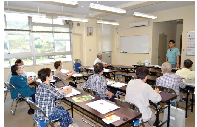
前回 9/10 教室の様子

※農産物品評会を11月24日開催予定で準備をしています。多数の出品をお願いします。