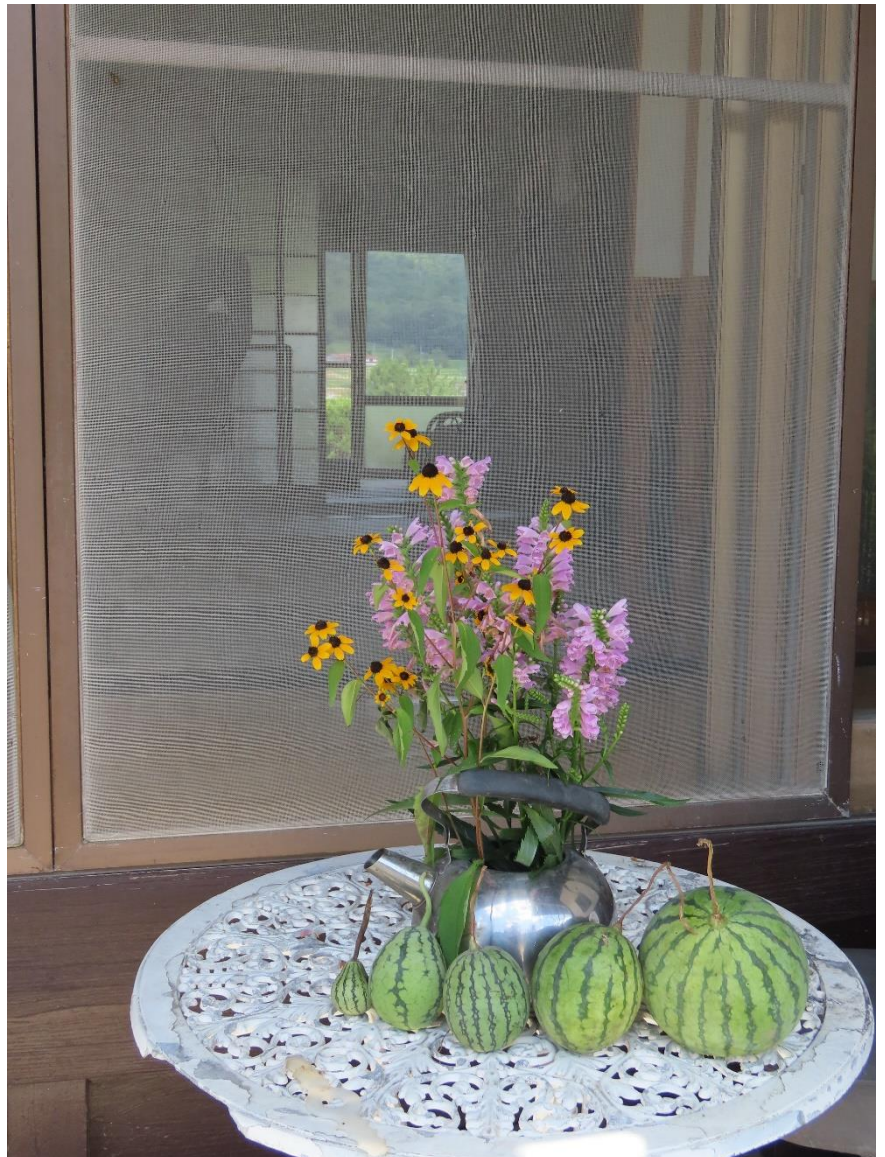
タイトル 「縁先から」

昨今の猛暑では、閉め切ってエアコンをきかせた室内から出るなど言われますが、ちょっと前まで日本の夏は家中あけ放って風を通して暮らしていました。畑から取って来たスイカを並べ ありあわせのやかんに庭の花を挿し 縁先から家の裏の畑まで風が吹き抜ける涼しい懐かしい日本の風景です。