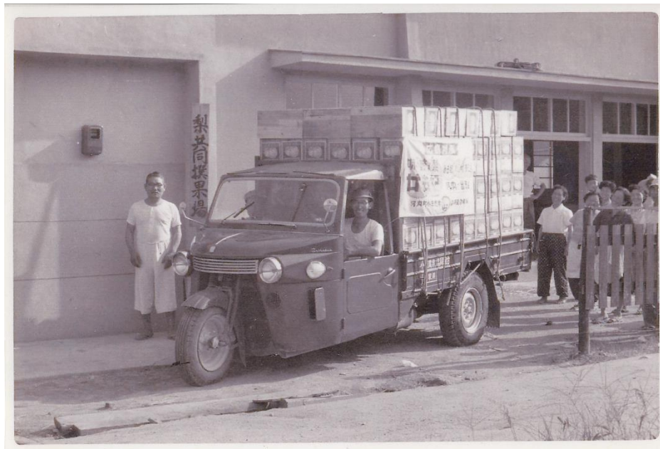
小田梨共同選果場「廿世紀梨」初出荷風景写真 昭和？

小田みんぞく事始めの会は、来る11月24日開催の生涯学習発表会に向け、記憶を留めるなつかしい、思い出の写真を募集しています。